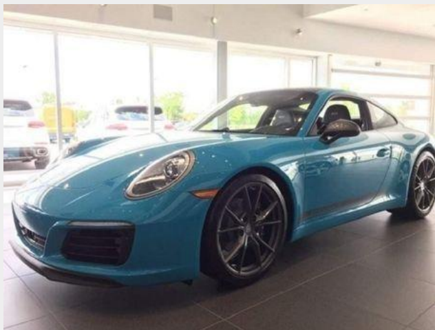
Véhicule en vedette : Porsche 911 Carrera T...