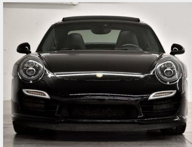
Véhicule vedette chez Porsche Rive-Sud :...

Atteindre des sommets La performance revisitée avec la nouvelle Collection Sport