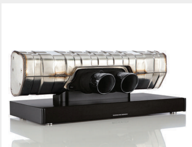
Barre de son Porsche 911 GT3