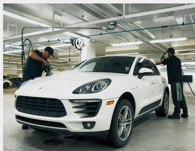
Nettoyage automobile à la vapeur