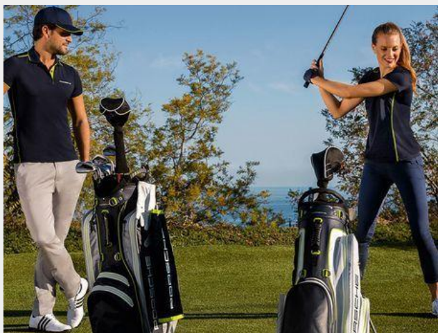
La nouvelle Collection Sport